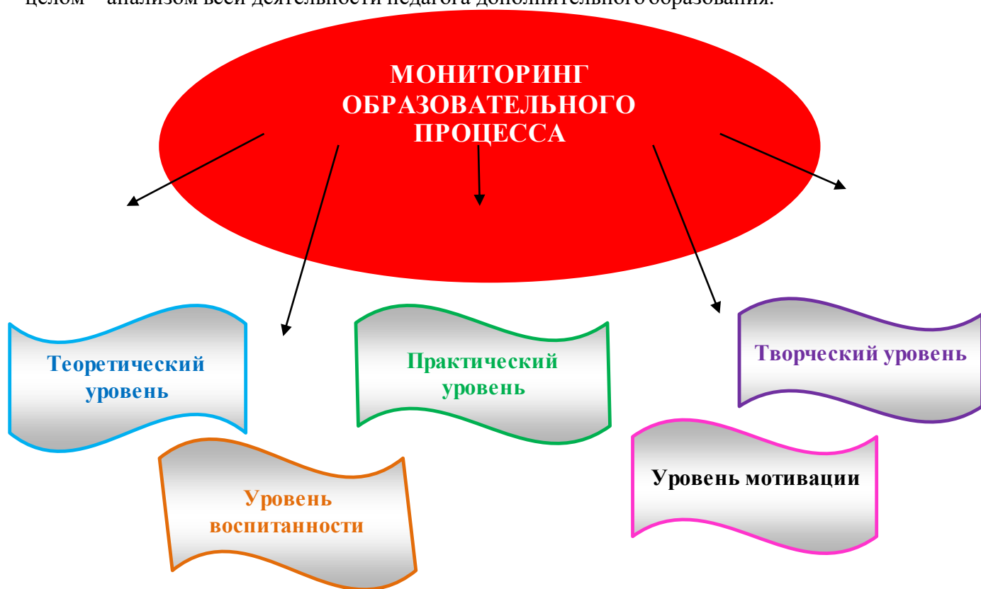
Рисунок 1 - Схема мониторинга образовательного процесса

Систематическое проведение мониторинга помогает своевременно обнаружить и откорректировать возникшие проблемы, то есть является своего рода индикатором, а в целом – анализом всей деятельности педагога дополнительного образования.