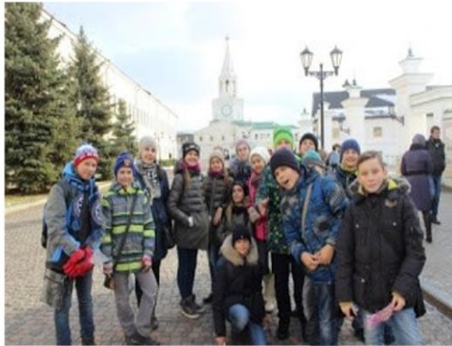
Республика Татарстан – субъект Российской Федерации