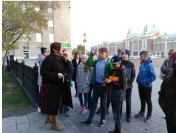
Новосибирская область - субъект Российской Федерации