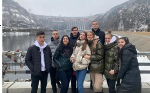
Республика Хакасия – субъект Российской Федерации