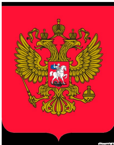
Герб Российской Федерации

Указом Президента России 30 ноября 1993 года введен новый государственный герб, рисунок которого выполнен по мотивам малого герба Российской империи 1883 года.