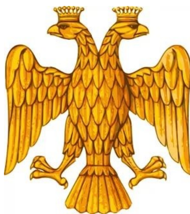
Двуглавый орел на государственной печати Ивана III

В «Истории государства Российского» Н.М. Карамзин высказал предположение, что символика русского герба ведет начало от печати, на которой впервые изображены вместе всадник, поражающий копьем дракона, и двуглавый орел с коронами на головах. Но если на печати Ивана III обе эмблемы выступают как бы на равных, занимая каждая свою сторону, то уже со следующего века двуглавый орел «завоевывает приоритет».